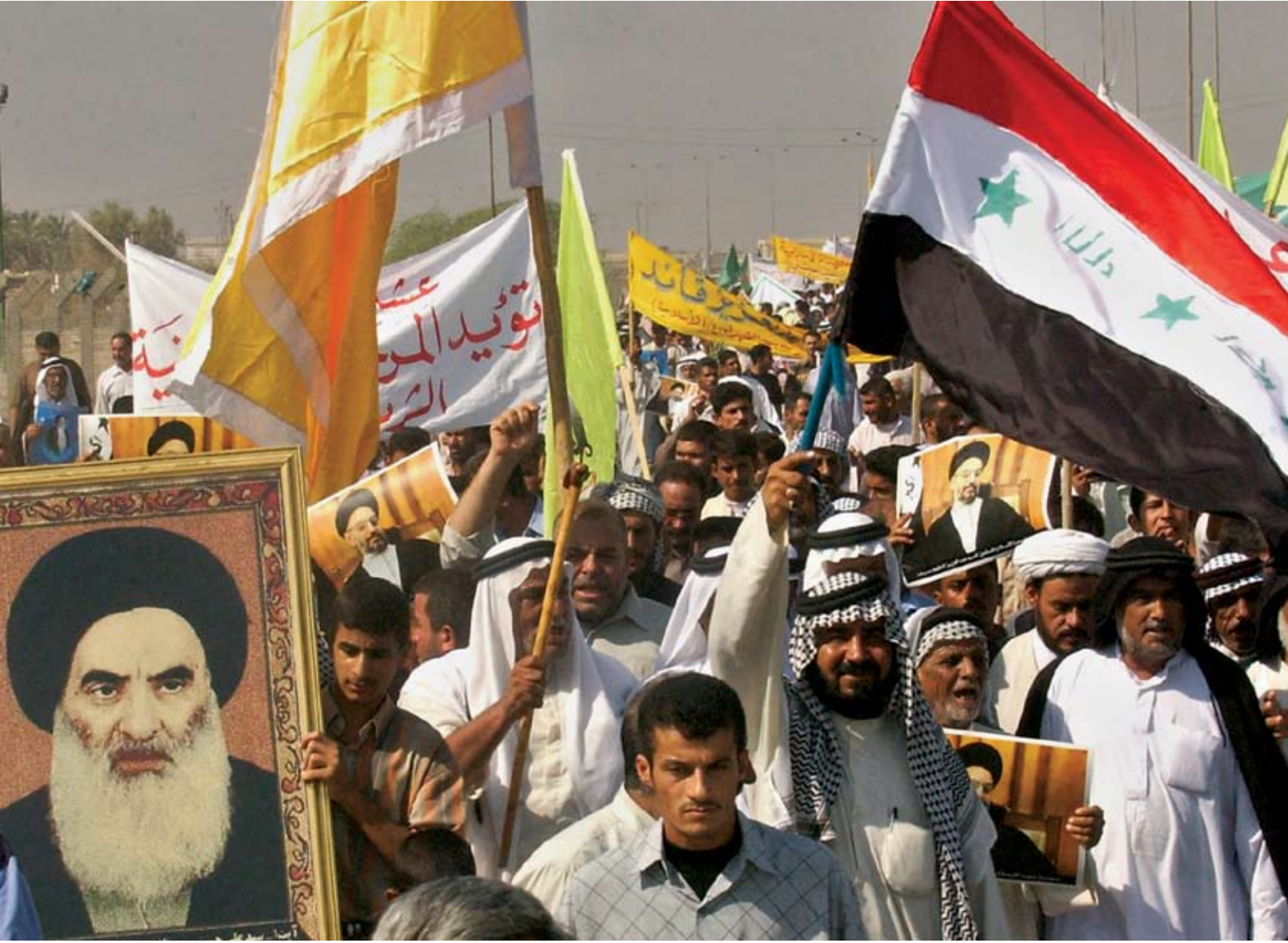
“Irak” kavramı yirminci yüzyıl başlarında Necef’te (ve bu arada Tikrit’te) ne kadar yaygın idiye, Basra’da da o kadar yaygındı.